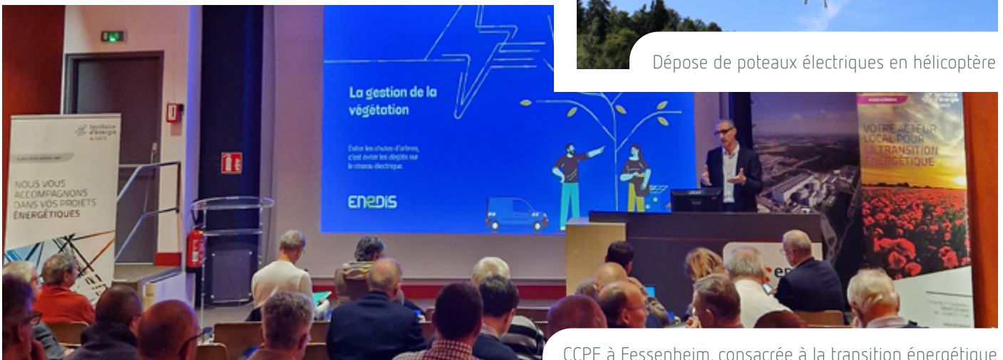
CCPE à Fessenheim, consacrée à la transition énergétique