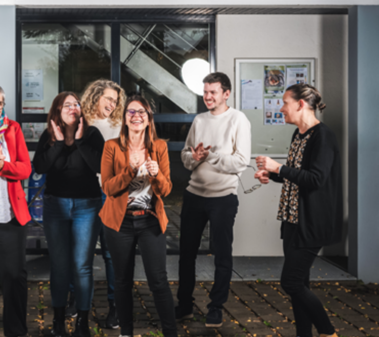
L'Équipe de Territoire d'Énergie Alsace