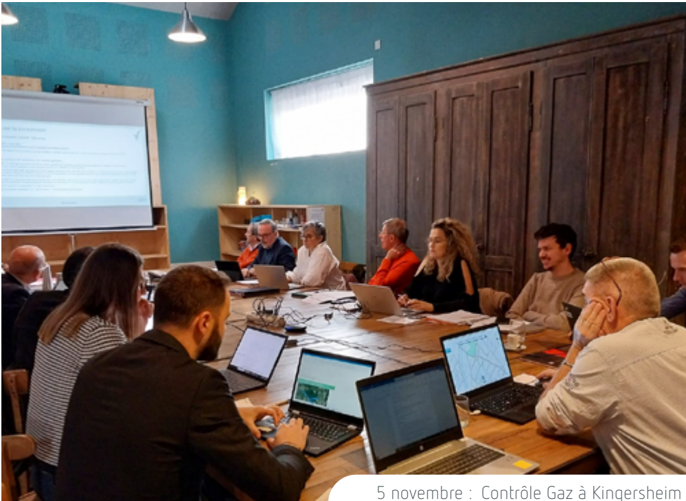
5 novembre : Contrôle Gaz à Kingersheim