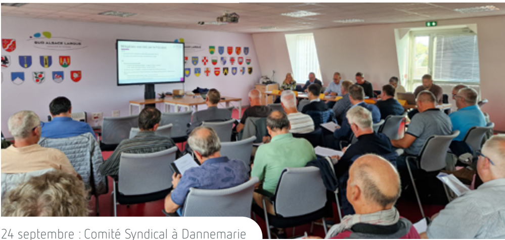
24 septembre : Comité Syndical à Dannemarie