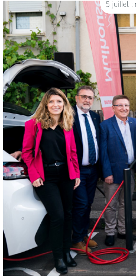
5 juillet :