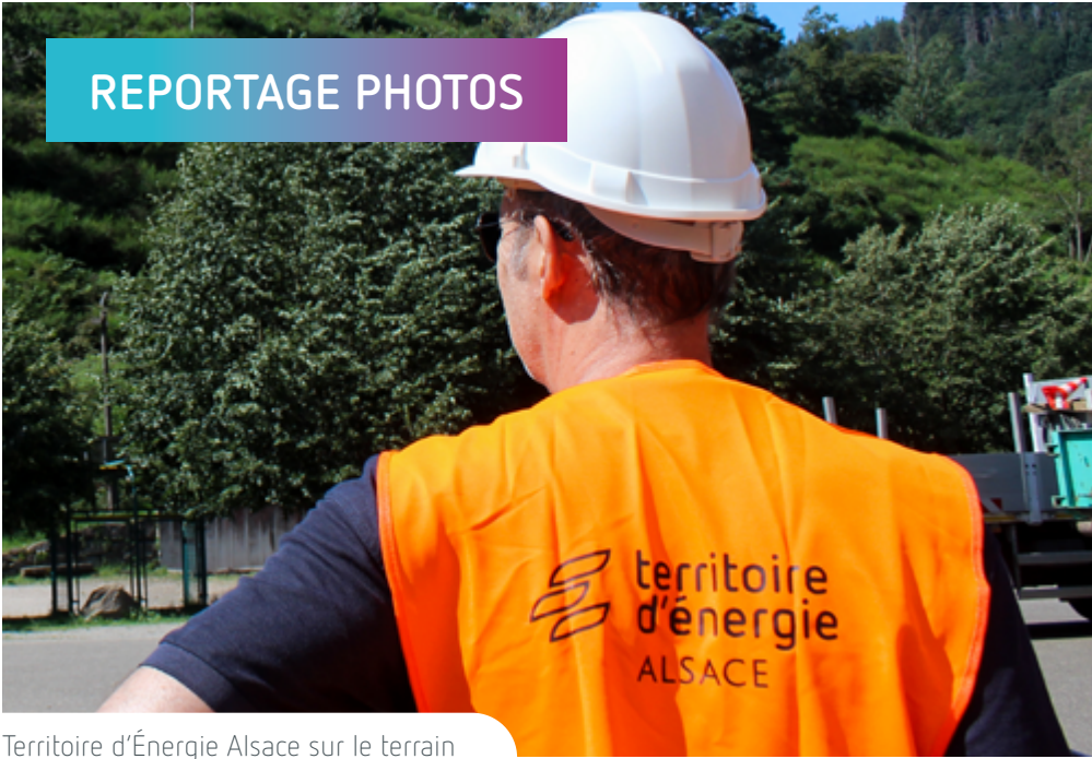
Territoire d'Énergie Alsace sur le terrain