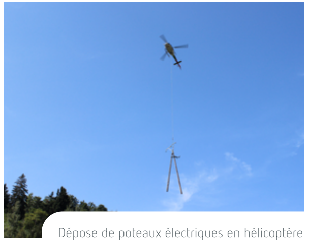
Dépose de poteaux électriques en hélicoptère